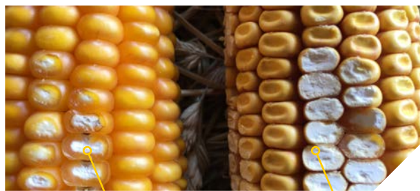
Grain corné denté* vitreux