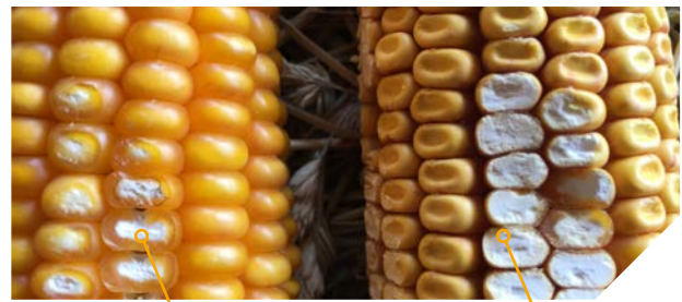
Grain corné denté* vitreux