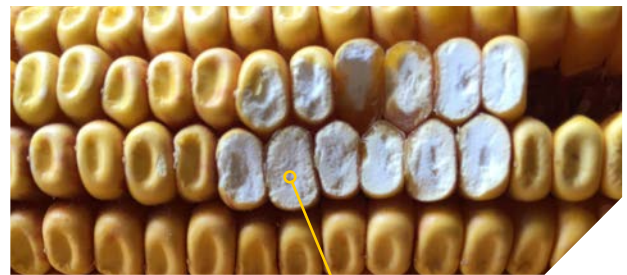
Grain denté farineux Pioneer