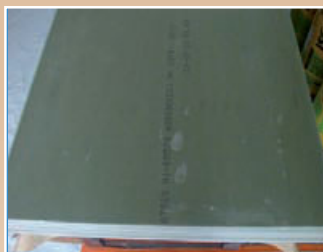
papier de protection des cloisons en plâtre destinées au bâtiment